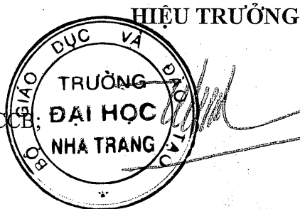
Trang Sĩ Trung